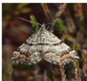
Carsia sororiata Manchester treble-bar

Vous trouverez ci-après la Figure 3, dans ses deux versions (anglaise et française), avec les légendes corrigées (remises à leur bonne place).