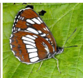
Neptis rivularis Hungarian glider