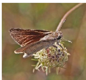
Gegenes pumilio Pigmy skipper