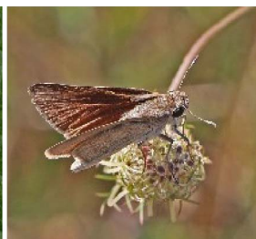
Gegenes pumilio L'Hespérie du Barbon