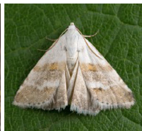
Eublemma minutata L'Anthophile de la Perlière