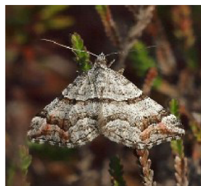
Carsia sororiata La Cidarie soeur